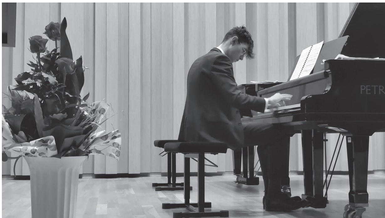
Miron Łajming podczas koncertu we Włocławku

https://eur-lex.europa.eu/legal-content/PL/TXT/PDF/?uri=CELEX:32018H0604(01)&from=E