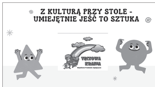
Rys. 1 Slajd tytułowy z prezentacji, „Z kulturą przy stole – umiejętnie jeść to sztuka”, materiał własny, Anna Klatecka

W Niepublicznym Anglojęzycznym Przedszkolu „Tęczowa Kraina” stworzyliśmy cykliczne „poranki z savoir-vivre”. Podczas prezentacji przedstawianych podczas spotkań dzieci nabywają i ugruntowują wiedzę z poszczególnych dziedzin. Podjęto następujące tematy: „Z kulturą przy stole – umiejętnie jeść to sztuka”, „Higiena – dbam o siebie i innych”, „Mój ubiór – czyli ubieram się odpowiednio do sytuacji”.