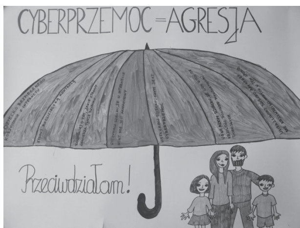
Plakat pedagogizujący rodziców w temacie bezpieczeństwa w sieci z uwzględnieniem zasad netykiety. Był powieszony w holu Przedszkola Miejskiego nr 3 im. Marii Kownackiej w Toruniu